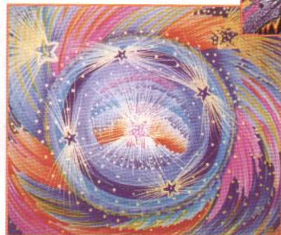
■ Cinq œuvres sélectionnées parmi ses mille cinq cents créations. A gauche : La Roue cosmique, 1995.