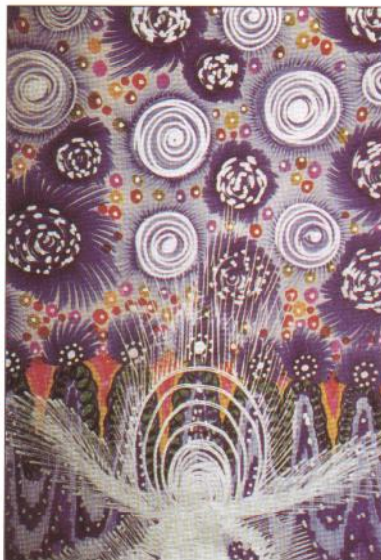
■ Les Roses cosmiques. Un véritable feu d'artifice de couleurs.